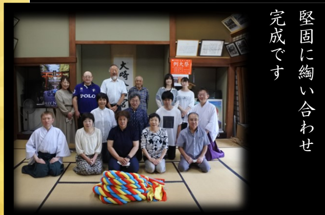
堅固に緋い合わせ 完成です