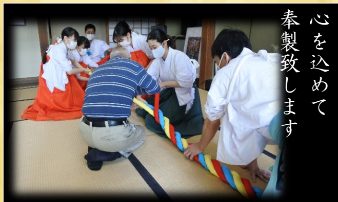
心を込めて 奉製致します