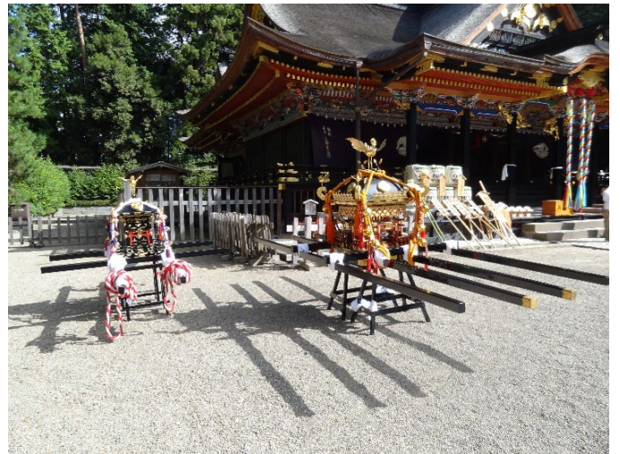
左：こども御輿 右：神輿